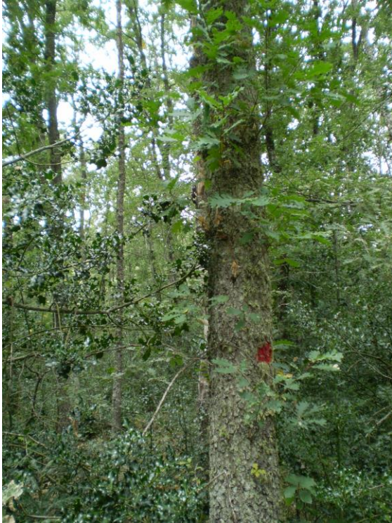
Foto 3. Brotes epicórmicos tras las cortas