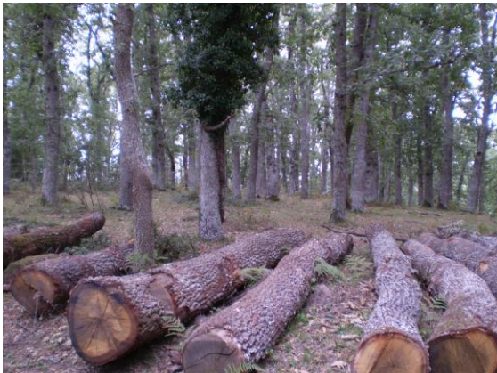
Foto 5. Aprovechamiento para duelas de barrica