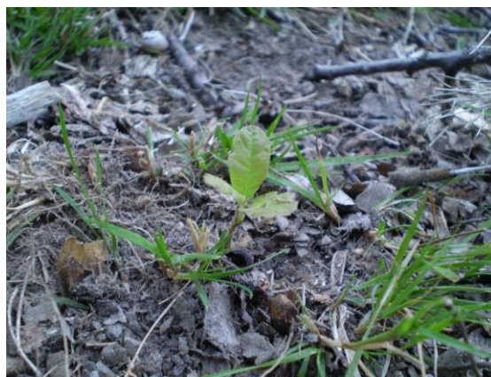
Foto 2. Regeneración por semilla