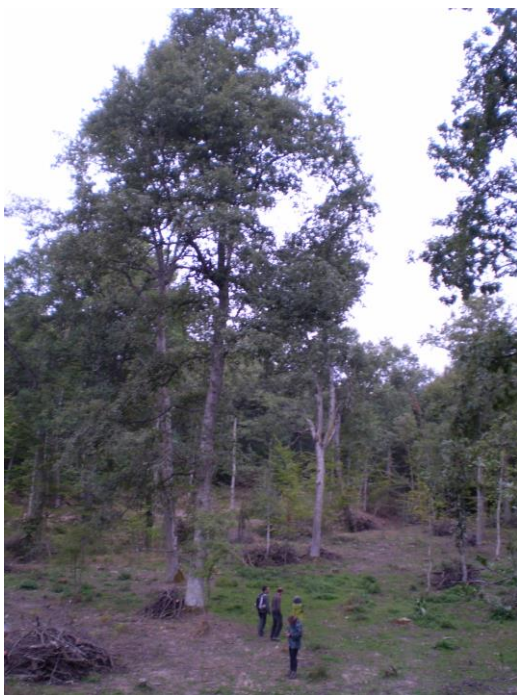
Foto 1. Ensayos de regeneración

Se visitan los ensayos de regeneración y los trabajos selvícolas realizados mediante claras por lo alto para la mejora del vigor de las masas.