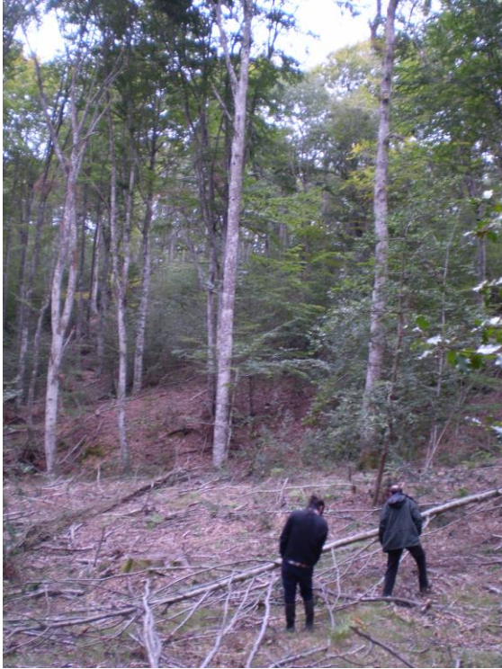
Foto 7. Apertura grandes claros