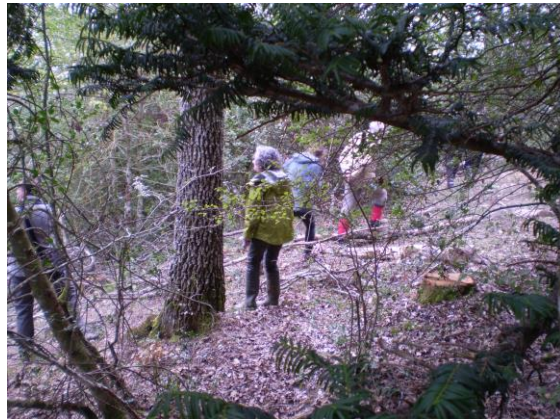
Foto 6. Mantenimiento de especies secundarias