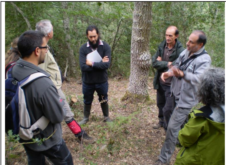
Foto 9. Explicación del representante del grupo de trabajo del pico mediano

En la reunión se expusieron las conclusiones y recomendación que ha desarrollado el grupo de trabajo del pico mediano en relación a los requerimientos de hábitat de esta especie.