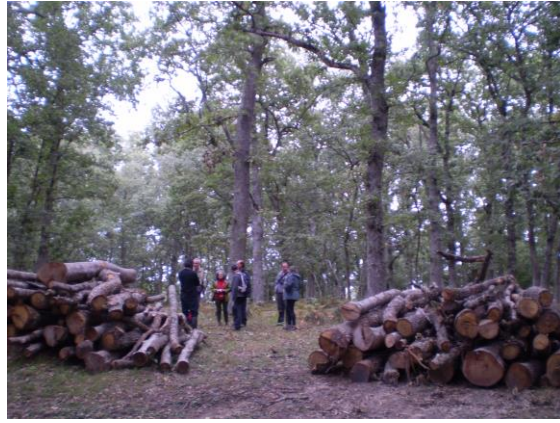
Foto 4. Aprovechamiento para leñas