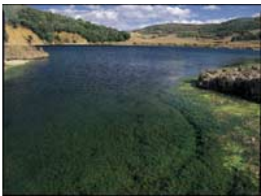
Lago de Caicedo