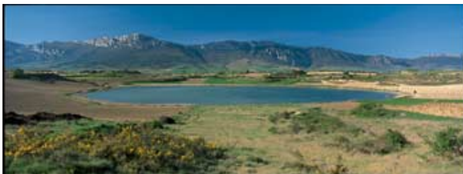
Lagunas de Laguardia