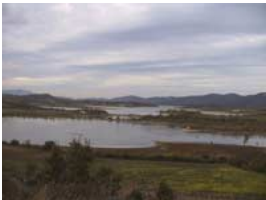
Colas del embalse de Ullívarri-Gamboa