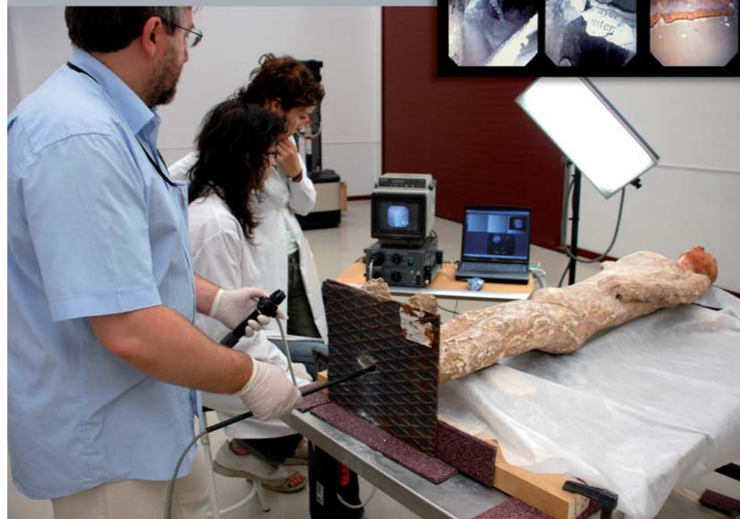
Barrualdearen azterketa endoskopia bidez. Estudio del interior con endoscopia.