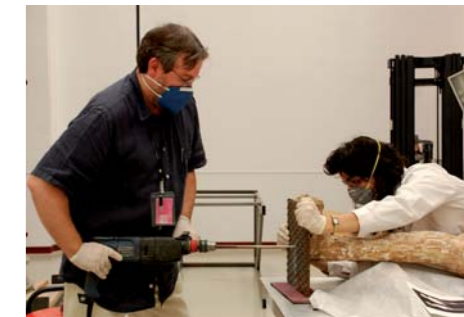
Azpiaren zulaketa. Perforación de la base.

Artelan garaikideak zaintzeko lan egiten duen zaharberritzaile taldearen lana eta lorpenak -ezinbestean ezkutuak- ezagutzera eman nahi dira foiletok honenkin.