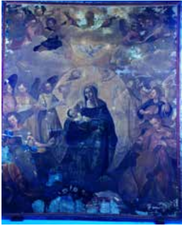
Argi ultramorearen azpian Bajo luz ultravioleta

Lanaren azterketa dela medio, nabaritu dugu gutxienez lehenagoko lau esku-hartze jasan dituela. Bi zaharretan, euskarria konpondu zen eta adabakiak ipini ziren urradurak konpontzeko. Geroago, lan honetan beste esku-hartze bat izan zen, datatu ezin izan duguna. Santa Anaren aurpegian eta jantzietan egindako aldaketetan datza. Mantuan eta jantzian berrukipen orokorra egin zen.