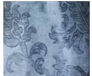
Brokatuaren erreflektografia Reflectografía del brocado

También en su rostro se han aplicado unos retoques oleosos de tono pardo para dibujar la comisura de los labios, unas pobladas cejas, sombras en los párpados y contorno nasal. Carecen de la delicadeza del trazo y del matiz del color que posee el resto de la composición. En las macrofotografías se ve la policromía original que subyace.