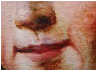
Birpolikromiaren xehetasuna Detalle de la repolicromía

batzuk eman ziren, ezpain ertzak, bekain lodiak, betazaletako itzalak eta sudurraren ingerada marrazteko. Konposizioaren gainerakoak dauzkan trazu emetasuna eta kolore ñabardura falta dituzte. Makrofotografietan, azpian dagoen jatorrizko polikromia ikus daiteke.