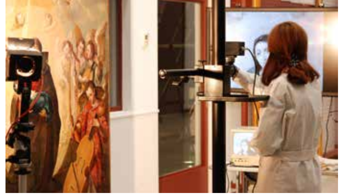
Erreflektografia egiten Realización de la reflectografía

A través del estudio de la obra hemos observado que presenta al menos cuatro intervenciones anteriores. Las dos más antiguas corresponden a reparaciones del soporte y colocación de parches para solucionar los rotos. Posteriormente hubo otra actuación en la obra, que no hemos podido datar cronológicamente y es la correspondiente a las modificaciones en el rostro y ropaje de Santa Ana. Se aplicó un retoque generalizado en el manto y el vestido.