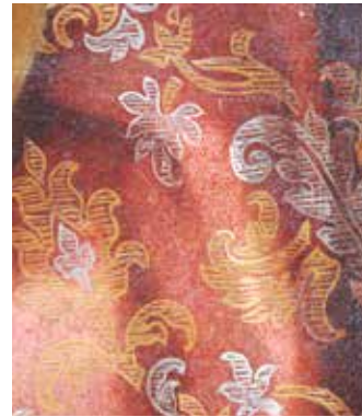
Brokatuaren xehetasuna Detalle del brocado