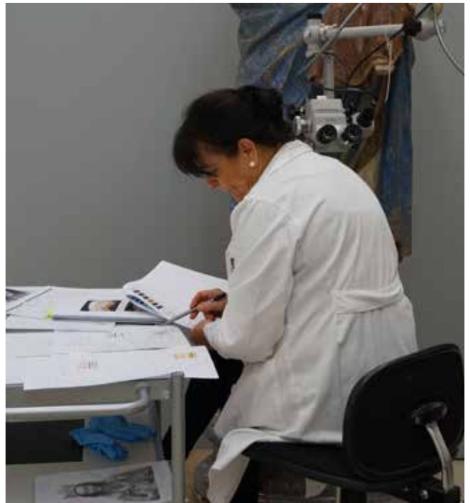
Polikromien korrespondentziaren azterlana Estudio de correspondencia de policromías