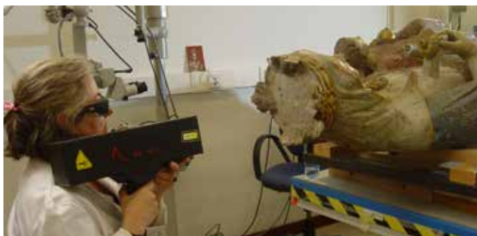
Lohi geruza kentzea laserrez eta tratamendua Eliminación de la capa de suciedad con láser y tratamiento

Azterketa eta zaharberritze proiektuak fase hauek izan ditu: kontserbazio egoeraren azterketa eta dokumentazioa, azterlan teknikoak, artxiboko dokumentazioa berrikustea, irudiaren historia materiala, polikromien korrespondentziaren azterlana, pintura geruzak tinkotzea, garbiketa eta elementu ez bateragarriak ezabatzea, berrintegrazio bolumetrikoa eta kromatikoa eta azken babesa.