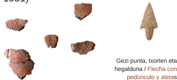
Gezi punta, txorten eta hegalduna / Flecha con pedúnculo y aletas Zintzilikariak / Colgantes