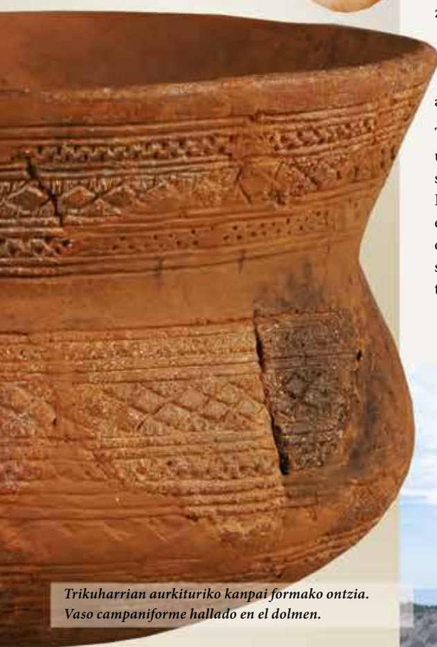
Trikuharriar aurkituriko kanpai formako ontzia. Vaso campaniforme hallado en el dolmen.