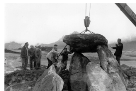
1974. Trikuharriaren zaharberritze lanak. Obras de restauración del dolmen.