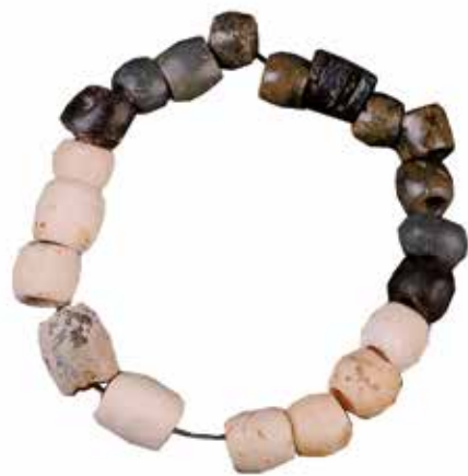
Trikuharrian aurkituriko giza apaingarriak. Elementos de adorno personal hallados en el dolmen.

La mayor parte de estos materiales se conservan en el Bibat. Museo de Arqueología de Álava (Vitoria-Gasteiz).