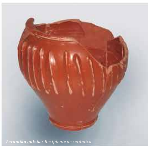
Zeramika ontzia / Recipiente de cerámica

La sociedad romana importó la costumbre del baño de Grecia, aunque añadiendo características propias, más prácticas y utilitarias. Aparecen así los baños públicos, las termas, abiertos desde el mediodía hasta el atardecer, con entrada a precios asequibles y libre tanto para hombres como para mujeres, aunque con horarios o espacios separados. Funcionaban de forma similar a los actuales centros cívicos, y servían para multitud de actividades: funcionaban como baños y piscinas públicas, como gimnasios o campos deportivos y de juegos, pero en ellas también se realizaban actos religiosos (el baño como purificación), actividades sociales y culturales (eran el lugar al que acudir para ver y para ser visto) y servían, incluso, para fines políticos, puesto que en ocasiones su construcción y su uso eran financiados por personas interesadas en hacer carrera política y ganarse así el apoyo de sus vecinos.