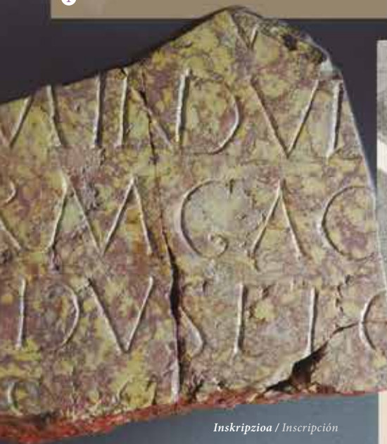
Inskripzioa / Inscripción