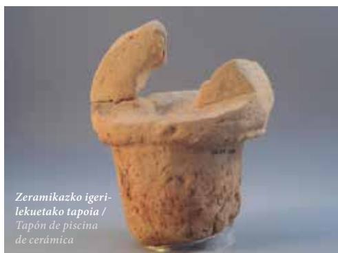
Zeramikazko igeri- lekuetako tapoia / Tapón de piscina de cerámica