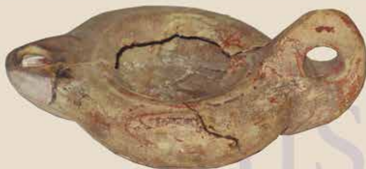
Olio lanpara / Lámpara de aceite