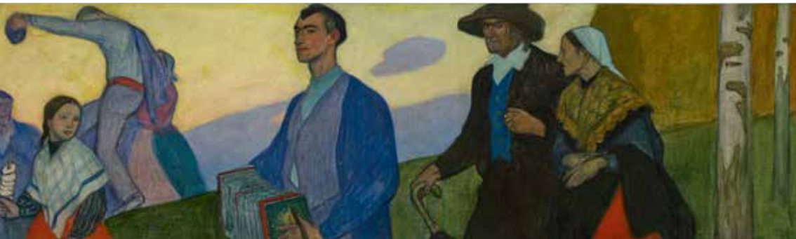
Aurelio Arteta (1879 – 1940). Errermeriatik bueltan. Volviendo de la romería. 1913

Paseo de Fray Francisco, 8 01007 Vitoria-Gasteiz Tel.: 945 18 19 18 Fax: 945 18 19 19 museobellasartes@araba.eus https://arteederrenmuseumoa.eus/es