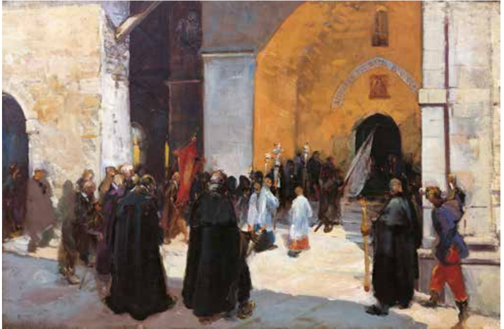
Pablo Uranga (1861-1934). Prozesioa Elgetan. Procesi3n en Elgeta. Hacia 1905