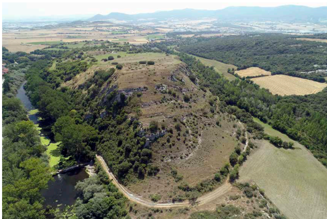
Fig. 2. Vista desde el río.

Emplazado al pie de la Sierra de Badaia, sobre un meandro del Zadorra, ocupa con sus 126 hectáreas de extensión todo el espolón de Arkiz y algunas fincas aledañas. Hacia el río el escarpe es acusado, alcanzando un desnivel máximo de 80 metros; hacia el interior, sin embargo, el descenso de la ladera resulta más suave. Es precisamente en esa zona media-baja donde nos encontramos el corazón del yacimiento de Iruña-Veleia: el oppidum —zona amurallada de unas 11 hectáreas— y el macellum —mercado altoimperial objeto principal de este estudio—.