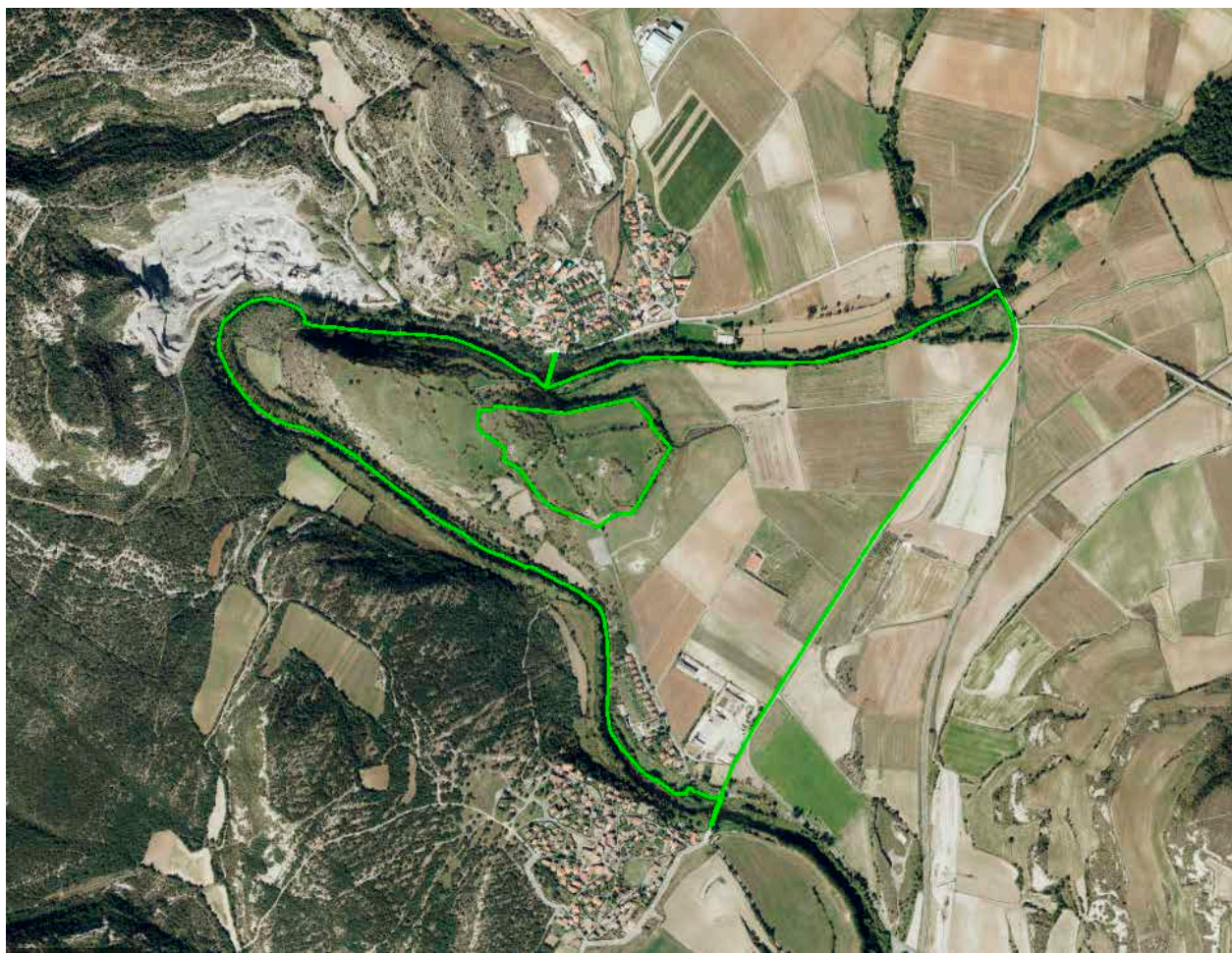
Fig. 3. Delimitación del yacimiento. La zona amurallada u oppidum se encuentra en el centro del yacimiento. Actualmente es la única área que cuenta con un régimen de protección legal específico.