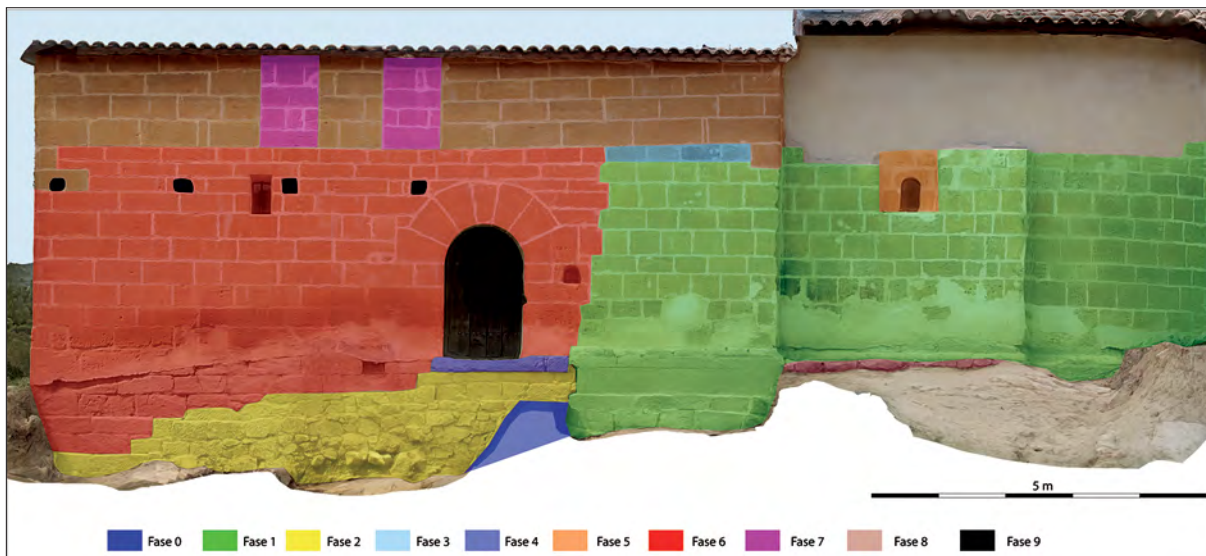
Santa Luzia basilizaren eraikuntzaren aldi nagusiak.