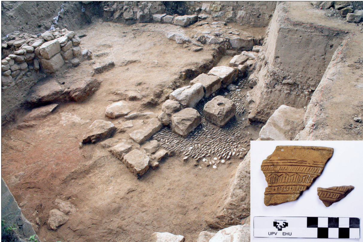
Torrentejon aurkitutako kanpai-formako zeramika. Beheko eskuineko angeluan: Torrentejoko palatium -a.