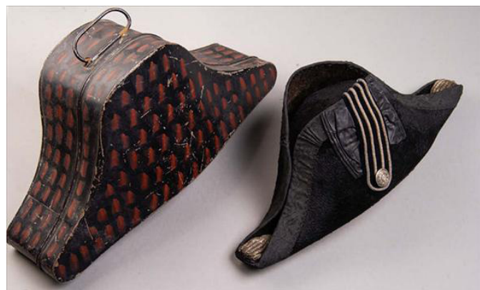
Ofizial britainiarren XIX. mendeko kutxatila eta adar biko kapela Estuche y bicornio de oficial británico del siglo XIX

Iraupen handiko piezak ziren haiek, eta horri esker oso egokiak ziren elementu hauskorak biltzeko eta babesteko kutxak egiteko. Militarren kapelen kutxatilik, esaterako, horren adibide dira. Gurea, hain zuzen ere, ingelesek XIX. mendean egindako lan tipikoa da. Zaharberrikuntza Zerbitzuak ez du aurkitu halako piezarik Espainiako beste bilduma edo museo batzuetan.