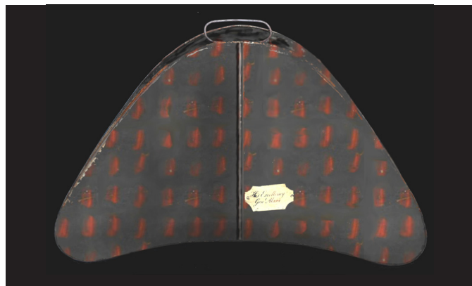
Alava jeneralaren kutxatilik daukan lakatuaren birsorkuntza Recreación del lacado del estuche del General Álava

Estas piezas resultaban muy duraderas, lo que las hizo muy apropiadas para la fabricación de cajas y contenedores para el embalaje y protección de elementos delicados. Es el caso, por ejemplo, de los estuches de sombreros militares que, como el nuestro, fueron una típica producción inglesa del siglo XIX. El Servicio de Restauración no ha encontrado ninguna pieza similar en otras colecciones o Museos españoles.