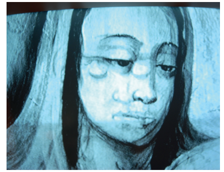
Infragorri errelektografia: konposizio aldaketa Ama Birjinaren aurpegian. Reflectografía infrarroja: cambio de composición en el rostro de la Virgen.