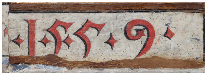
Birpintatze baten azpian ezkutuan zegoen erretaularen amaiera data. 1559 Fecha de finalización del retablo que estaba oculta bajo un repinte. 1559

Este relevante retablo presentaba un ataque gravísimo de hongos y de insectos xilófagos que estaban afectando al estrato pictórico y al soporte leñoso. El amarilleamiento de la capa de barniz y los repintes localizados en numerosas tablas policromadas impedían apreciar el verdadero cromatismo de las tablas.