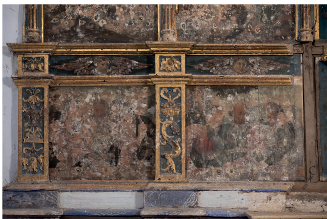
Ondoen kolonizazioa. Colonización de hongos.

Erretaula garrantzitsu hori oso kaltetuta zegoen ondo eta intsektu xilofagoen eraso larriaren ondorioz, zeinak pintura geruza eta zurezko euskarria kaltetzen ari baitziren. Berniz geruza horituta izateak eta taula polikromatu asko birpintatu izanak taulen benetako kromatismoari antzematea eragozten zuen.