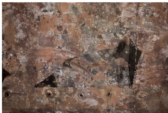
Ondoen xehetasuna. Detalle de los hongos.

Este relevante retablo presentaba un ataque gravísimo de hongos y de insectos xilófagos que estaban afectando al estrato pictórico y al soporte leñoso. El amarilleamiento de la capa de barniz y los repintes localizados en numerosas tablas policromadas impedían apreciar el verdadero cromatismo de las tablas.