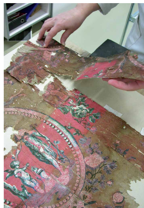
Zaharberritze prozesuaren xehetasunak: bereizita, japoniar paperezko hesi bat jartzea eta muntatzea. Detalles del proceso de restauración: separado, colocación de una barrera de papel japonés y montaje.