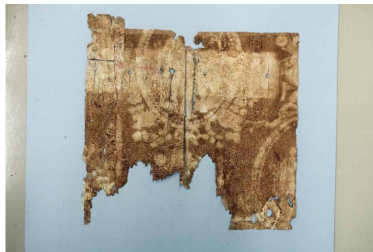
Euskarria ilunduta. Aurrealdea eta atzealdea Oscurecimiento del soporte. Anverso y reverso

Paper ilundu, zikin, desitsatsi, hautsi eta kolorerik gabe eta askatu zatiak kontserbatzen ziren. Atea indartzeko gehitutako egurrezko bi langetak ezkutatu egiten zuten motiboaren zati bat. Metalezko, zurezko eta paperezko elementuen gainean esku hartu da, eta gehigarriak kendu dira.